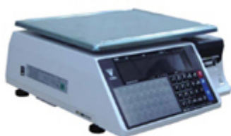
DIGI SM-100B CS+